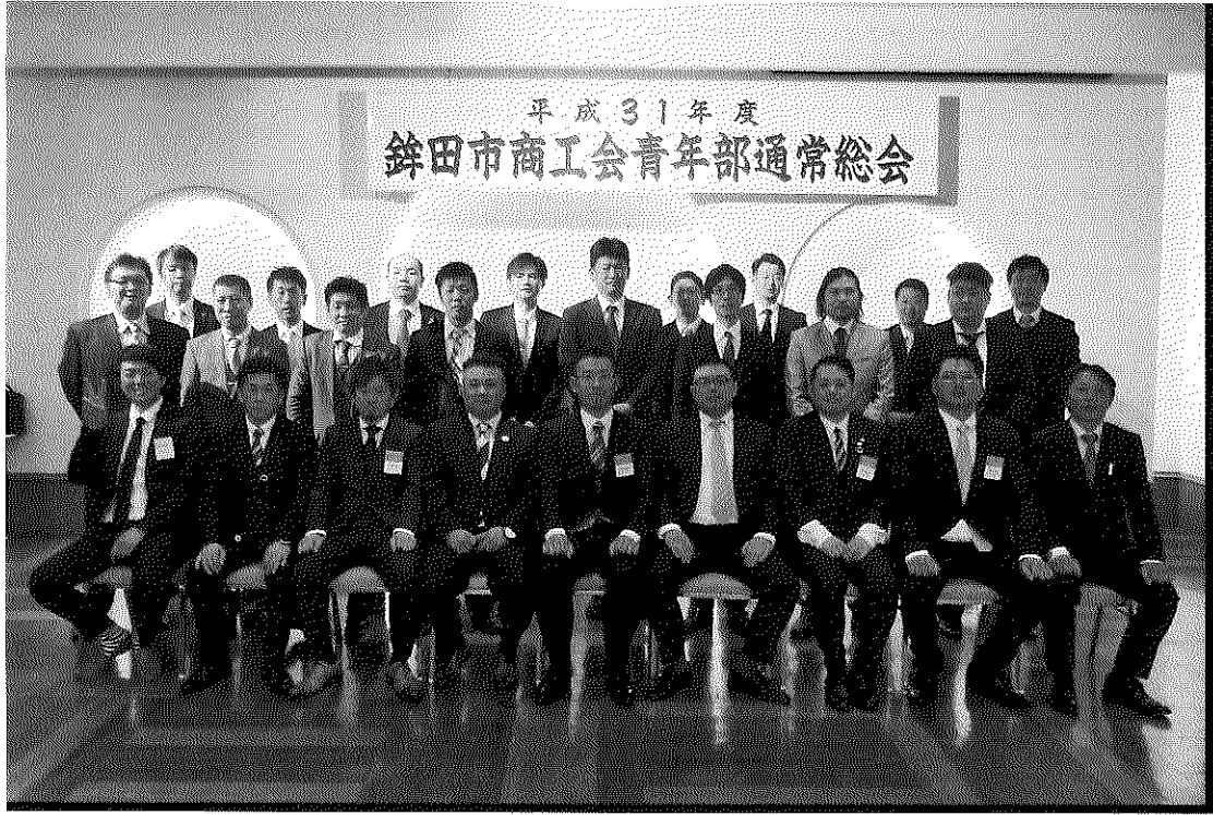
平成31年度 銚田市商工会青年部通常総会

銚田市商工会 青年部執行部決まる 去る平成三十一年四月十日(水)午後七時、ホテルさわやかに、銚田市商工会青年部の通常総会が開催され平成三十一年度事業報告を始め提出された議案は異議なく承認されました。 また、任期満了に伴う役員の変更については、あらたに下記の通り選出されました。