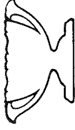
62年度 町民駅伝 一般の部 3位入賞