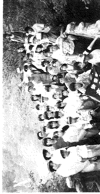
霧降高城ハイキング 参加者一同記念写真