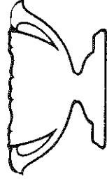
63年度 いばらき駅伝88県南コース 鉦田チーム男子の部優勝