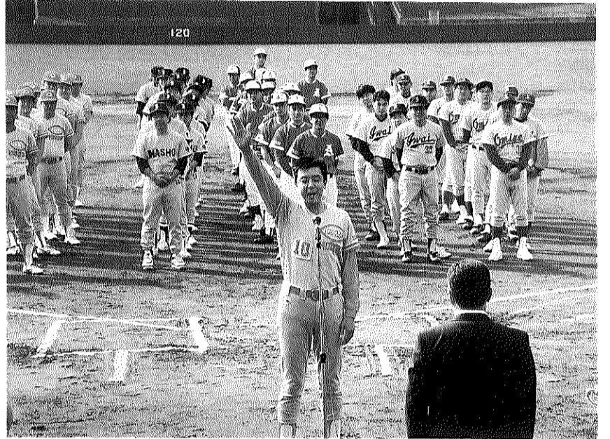
岡里主将の晴舞台 選手宣誓!!

誰にでも出来る事ではないので、人生の良い思い出になったと思います。 又、野球部を応援頂いた皆さん一年間どうもありがとうございました。 私たち野球部は、本年も県大会に向け練習を重ね、今度は優勝をねらってチーム一丸となって頑張っています。本年も引き続き応援のほどよろしくお願い致します。