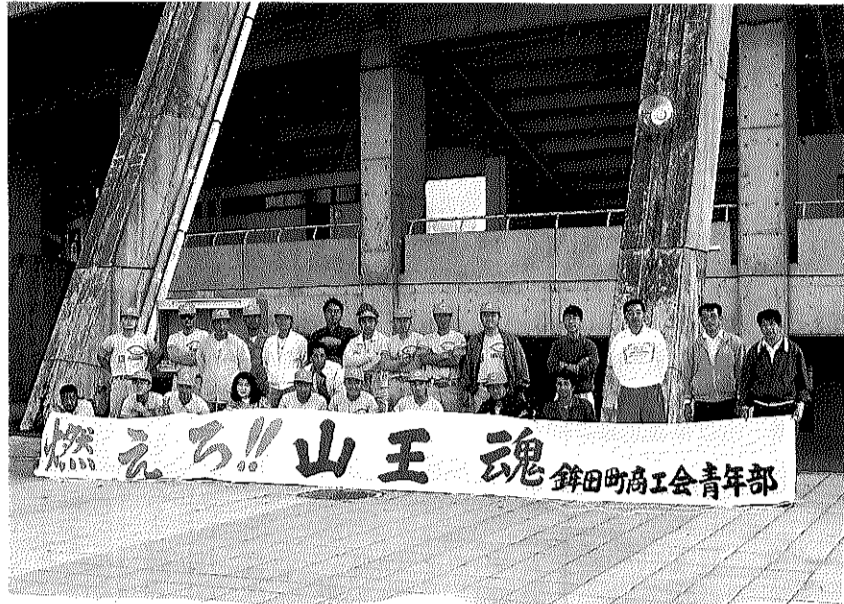
水戸市民球場前にて