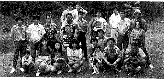
者みんなが楽しかったと言った。大成功だったと思います。ちょっと疲れの見える参加者

青年部ハイキング 六月七日牛久にてハイキンググ&バーベキューを行ないました。参加人数は二十九名で青年部員の家族や一般募集の若い男女で出発しました。天気は朝から曇っていましたが、なんと雨が降り止みました。最初の目的地牛久自然観察の森は無事着きました。自然の森では思ったより歩く距離が長かったけれどそれなりに楽しかった。