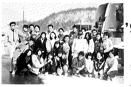
さー これから滑るぞー

今年もまた青年部のスキーツアーに、行ってまいりました。風揚げ大会がずれ込んだので、当初の予定より一週間遅れになり、不幸にも参加者が定員割れで、募集の半分くらいになってしまいました。しかし強気の青年部、そこは強行突破、昨年と同じ裏磐梯猫魔スキー場に、今年は一泊二日のスケージュール。初日は吹雪。ほとんどのスキーヤーは、レストハウスにこもりっきりになり、ゲレンデは日曜だと言っているのにガラガラで、結構思った様にすべりました。